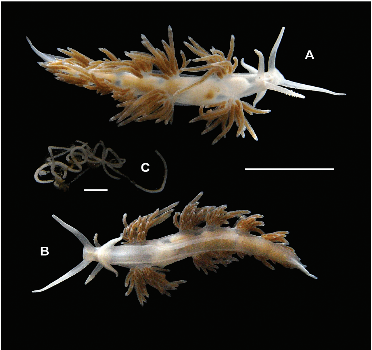
Figura 1. Dondice parguerensis , A, vista dorsal; B, vista ventral, escala= 10 \mu\text{m} , C, puesta, escala= 2 \mu\text{m} .

\mu\text{m} de largo por 108-120 \mu\text{m} de ancho, los últimos de la cinta generalmente mayores.